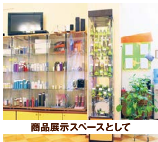
商品展示スペースとして

PR・販促の他、副業・独立・起業・東京進出等の 期間限定の店舗・サロンの出店にお使い頂けます。