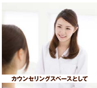
カウンセリングスペースとして