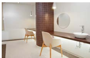
パウダースペース