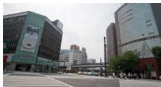
銀座駅（C2出口）から徒歩2分