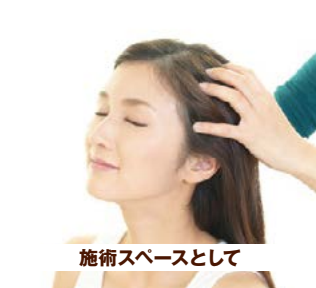
施術スペースとして