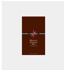
ショップカード作成 [ 300枚 ]