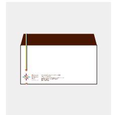
封筒作成(長3) [ 1,000枚 ]

上記プランより追加、削減等ありましたらお気軽にお申し付けください また、上記プランは紙質や形式等一般的な案を採用していますが、もっと個性を出したい等ございましたら、 ご相談させていただきます。