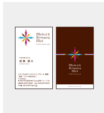
名刺作成 [ 300枚 ]