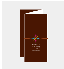
パンフレット作成 [ A4三折 500枚 ]