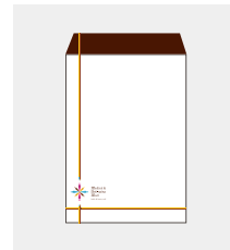
封筒作成(角2) [ 1,000枚 ]