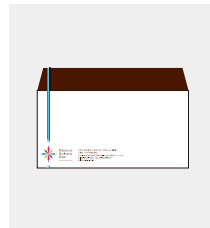
封筒作成(長3) [ 1,000枚 ]